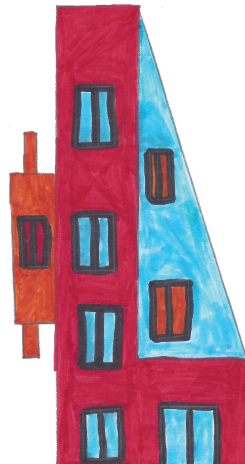
Lucas, Lauréat 9-11 ans, édition 2013